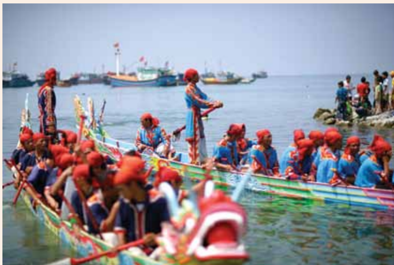
>> Lễ Khao tế tế lính Hoàng Sa tại đảo Lý Sơn, Quảng Ngãi

các đội Thủy quân. Vì thế trong lịch sử chủ quyền của Việt Nam ở Hoàng Sa và Trường Sa, có những lúc hoạt động của đội Hoàng Sa rất nổi bật, nhưng cũng có những lúc bị lu mờ, thậm chí có khi bị ghép chung vào công việc của đội Thủy quân. Chúng ta từng biết có triều đình đã từng quyết định bãi bỏ đội Hoàng Sa và chuyển công việc của đội Hoàng Sa cho đội Thủy quân, nhưng ngay sau đó họ lại phải tính chuyện tái lập... Các đội Hoàng Sa, Bắc Hải dù hoạt động độc lập hay phụ thuộc vào đội Thủy quân, thậm chí có là hoạt động dưới danh nghĩa của đội Thủy quân đi nữa, thì cứ vẫn là một tổ chức độc đáo của các Nhà nước Việt Nam thế kỷ XVII, XVIII, XIX trong chủ