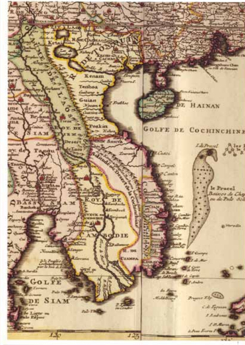
>> Bản đồ của Công ty Đông Ấn Hà Lan

trương khẳng định chủ quyền của mình ở Hoàng Sa và Trường Sa mà không có bất cứ một quốc gia nào trong khu vực có được.