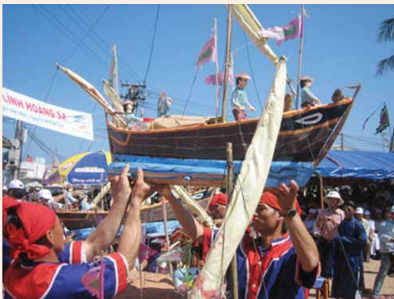
>> Thuyền nan dùng cho binh phu đi Hoàng Sa được phục dựng trong Lễ khao tế tế lính Hoàng Sa

Tư liệu về nguồn gốc, chức năng và hoạt động của các đội Hoàng Sa và Bắc Hải (trong đó đặc biệt là đội Hoàng Sa) càng ngày càng được tập hợp phong phú hơn, đa dạng hơn. Chúng ta không chỉ biết về các đội Hoàng Sa, Bắc Hải trong chủ trương thành lập và chỉ đạo hoạt động của các Chúa Nguyễn, của Vương triều Tây Sơn và các vua nhà Nguyễn, mà còn biết khá cụ thể các chủ trương ấy đã được chính quyền và nhân dân các địa phương tự giác chấp hành và thực hiện một cách đầy đủ và hết sức nghiêm chỉnh. Đây không chỉ dừng lại ở những văn bản chính thức của Nhà nước và những hoạt động phong phú đa dạng ở